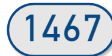
Volume - 12 derniers mois