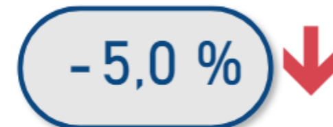
Evolution en volume - 12 derniers mois