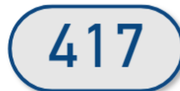
Volume - Trimestre