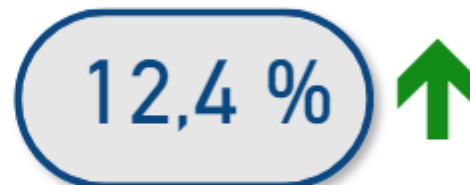
Evolution en volume - Trimestre