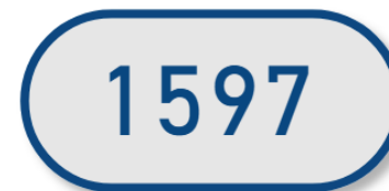
Evolution en volume - 12 derniers mois