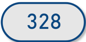
Evolution en volume - Trimestre