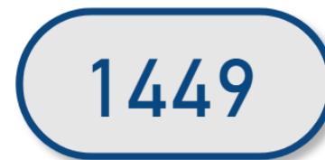
Evolution en volume - 12 derniers mois