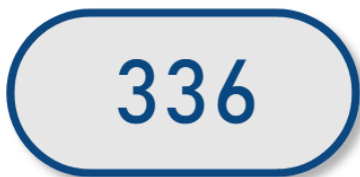
Evolution en volume - Trimestre